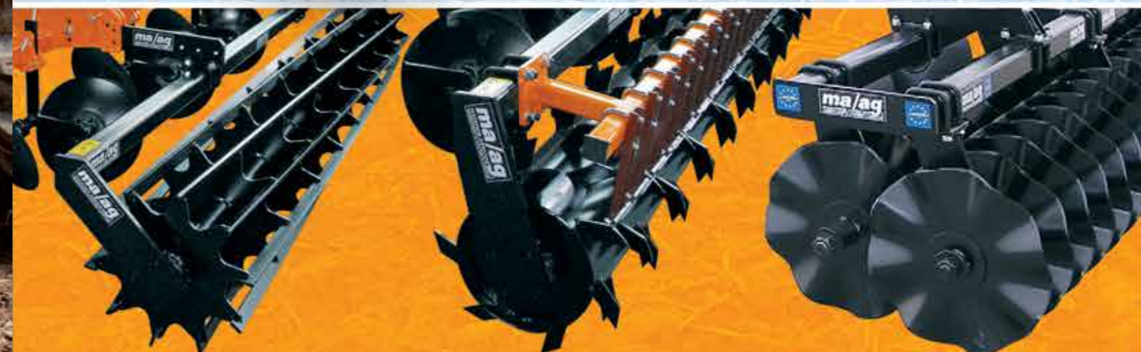
szimpla pálcás henger mechanikusan 1