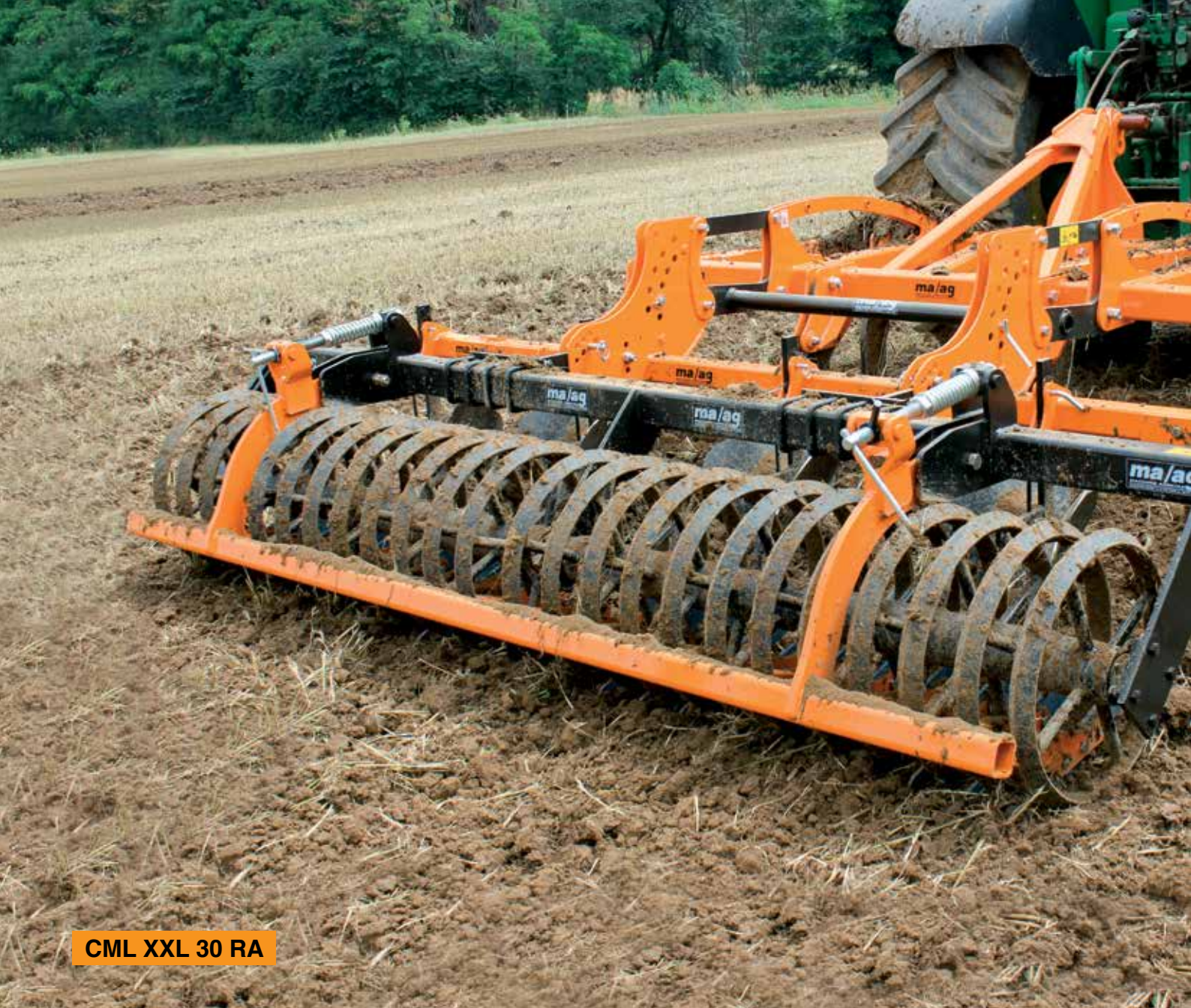
CML XXL 30 RA